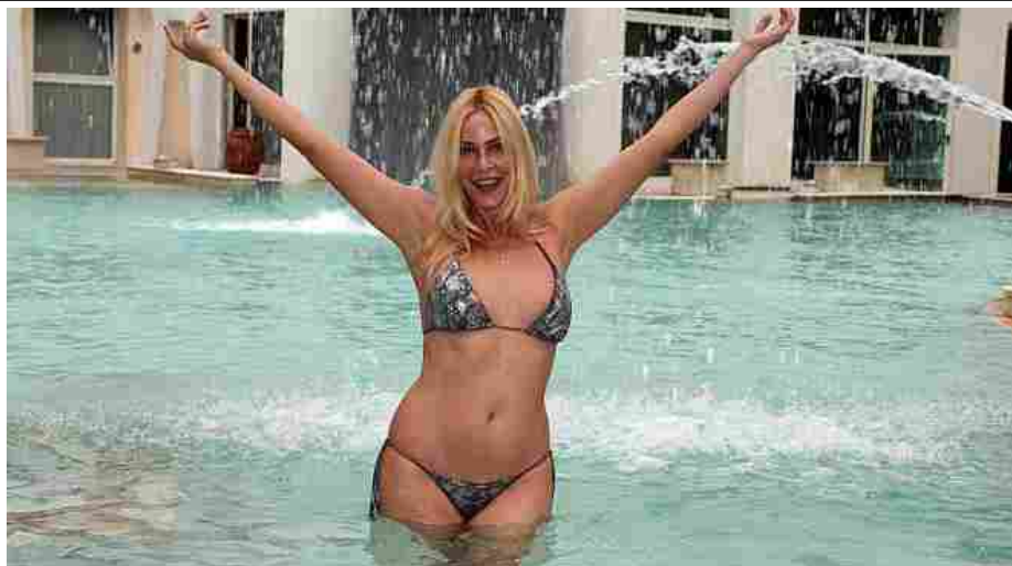
Dopo le paure e le misure d'emergenza per la pandemia esplode la voglia di vacanza

Milano, 9 maggio 2021 - Per il 2021 scelgo di restare in Italia. Il 54% dei nostri connazionali resterà nel nostro Paese per le prossime vacanze ed in viaggio in Ue ci sarà il 56% europei. Secondo i dati di Euromonitor si vince che nel 2026 il giro d'affari mondiale del turismo sarà pari a circa 1.400 miliardi di dollari. L'Italia recupererà i livelli pre-pandemia nel 2025, confermandosi al quarto posto in Europa con poco meno di 60 miliardi di dollari.