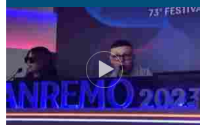
Sanremo, Lanza: vorrei le scuse di quelli che mi snobavano