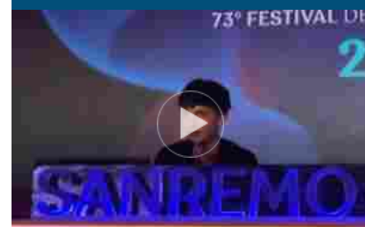
Sanremo, Ultimo quarto con Alba