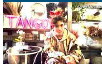
Sanremo, Tananai quinto con Tango