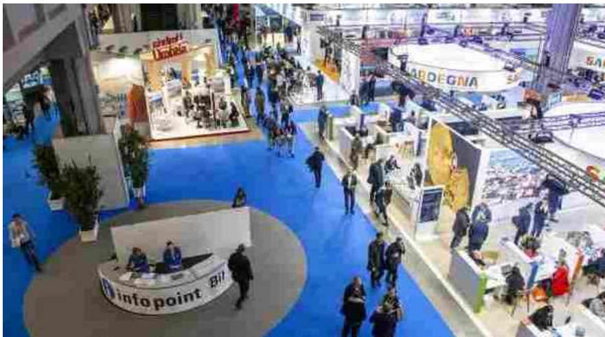
13 novembre 2020