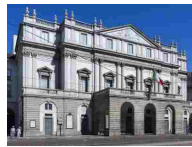
TEATRO ALLA SCALA