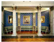
MUSEO TEATRALE ALLA SCALA